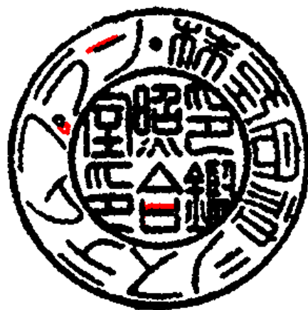
二つの良く似た印影の照合結果

朱肉で押された印影同士や印鑑証明書などのコピー印影の照合も可能です。また、手動操作でも印影の回転、平行移動、濃淡調整等ができます（取り込んだ印影の大きさ変更は不可）。ボタン操作一つで照合結果の印刷も可能ですので、照合結果の保存が容易です（データファイルでの保存機能はありません）。